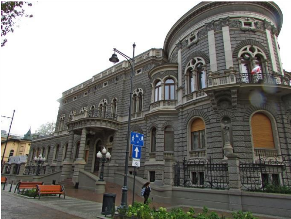
„Ziemia obiecana” – reż. A.Wajda

Chodząc ulicami Łodzi, rozpoznajemy plany filmowe: