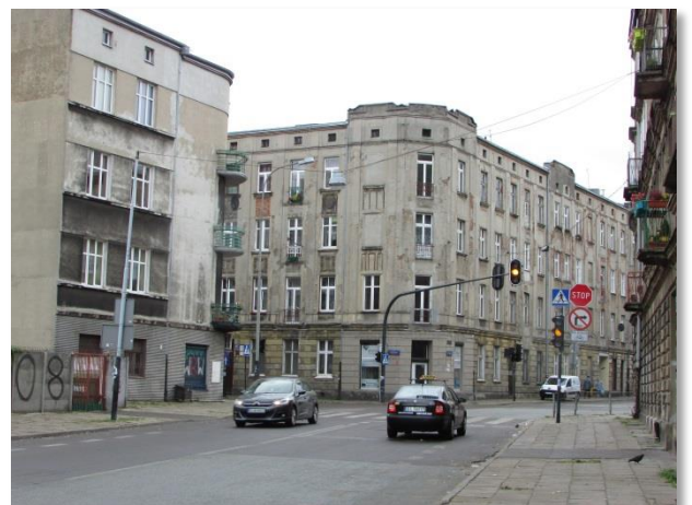
„Powidoki” reż. A.Wajda