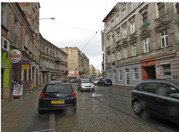
„Ida” reż. P.Pawlikowski